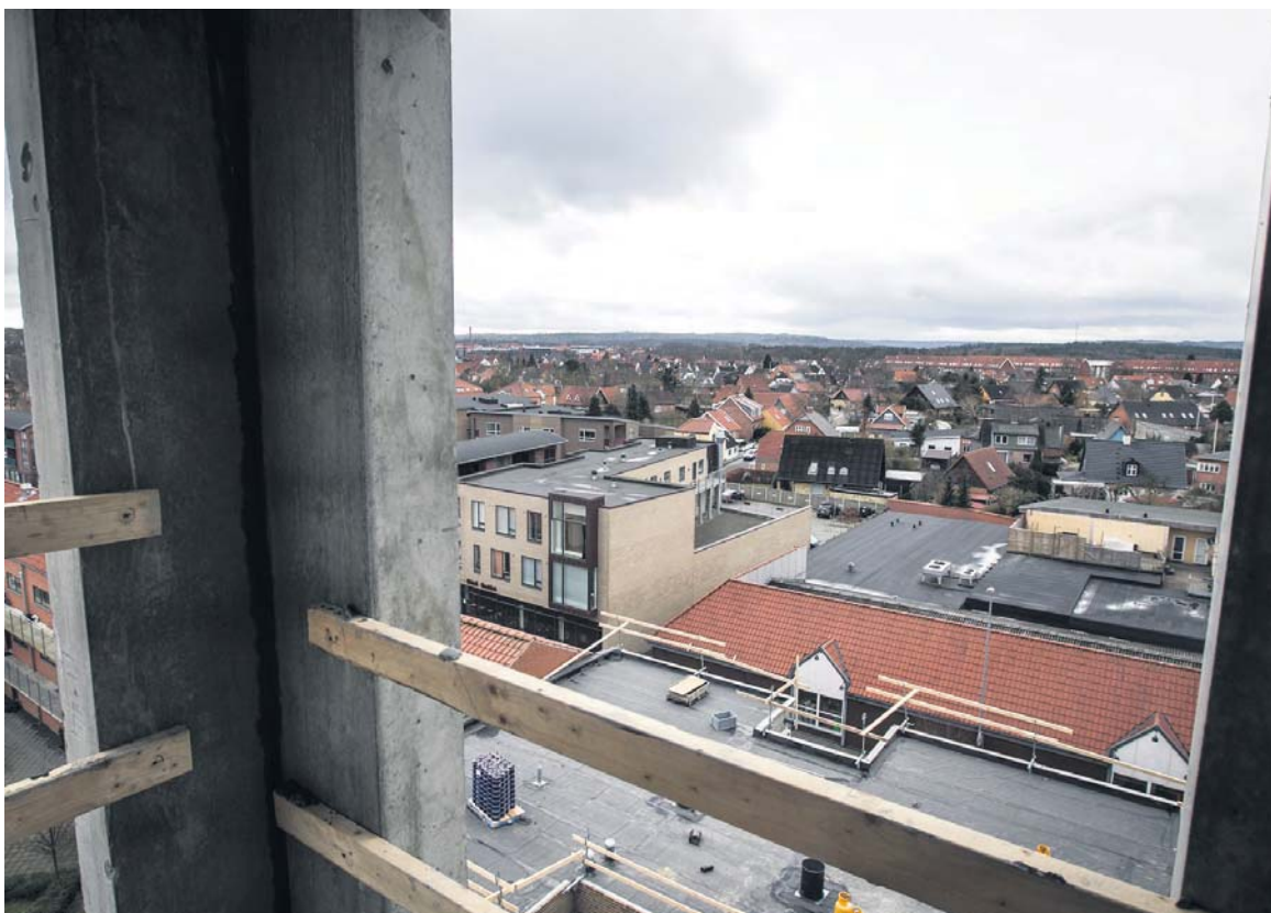
Man kan se langt omkring fra toppen af Borgparken. Der bliver grønt fællesområde for beboerne, og man får sågar en lille sø som nærmeste nabo.

Søndag den 1. marts kl. 14: Silkeborg Kirkes sognelokaler, Torvet, Silkeborg: Syng i den Blå